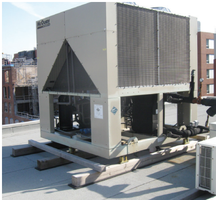
APPAREIL DE MÉCANIQUE DE PLUS DE 70 KG (150 LB) DÉPOSÉ SUR LA COUVERTURE

Pour ces anomalies, aucun correctif n'est exigé pour le moment. Un suivi annuel des déficiences observées est fortement recommandé afin de s'assurer qu'il n'y ait aucun risque à court-moyen terme pour le complexe d'étanchéité par la détérioration de ces anomalies.