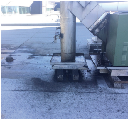
BAC DE RÉCUPÉRATION DES GRAISSES (DÉVERSEMENT)

Certains éléments de la couverture nécessitent une attention particulière. Ces éléments pourraient compromettre l'étanchéité du système. L'attention du propriétaire envers ces éléments est requise.