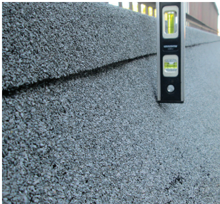
DÉCOLLEMENT DES SOLINS MEMBRANÉS

Intervention du propriétaire : Vérifier si des infiltrations ou si des déficiences pouvant causer des infiltrations sont présentes. En présence de ces déficiences, communiquer avec l'Association ou votre couvreur d'origine.