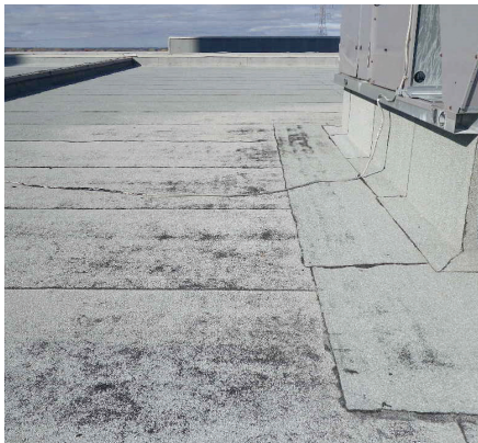
USURE PRÉMATURÉE DES MEMBRANES

Intervention du propriétaire : Vérifier si des trottoirs ou des membranes supplémentaires protègent ces sections. Le cas contraire, une protection supplémentaire installée par un Maître Couvreur est recommandée.